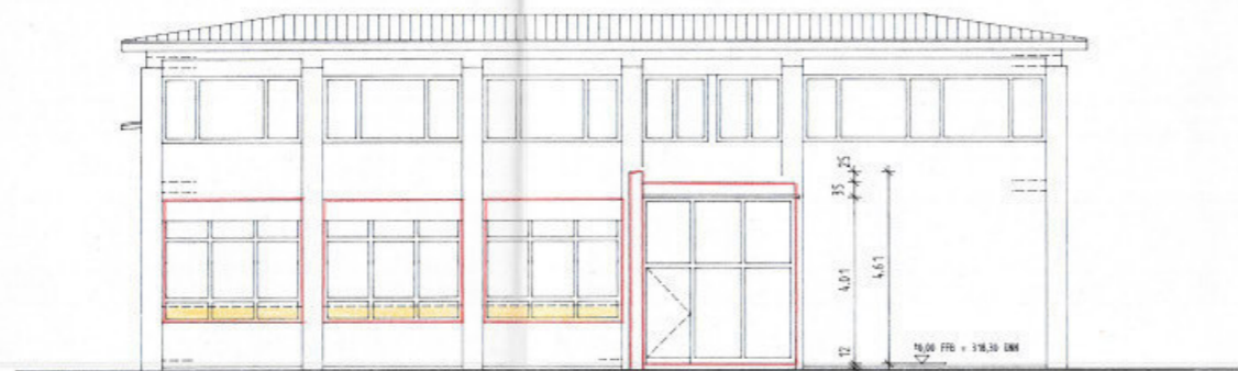
Ostansicht M. 1:100

Genehmigt am 13. JUNI 2003 Stadt Göppingen Bürgermeisteramt