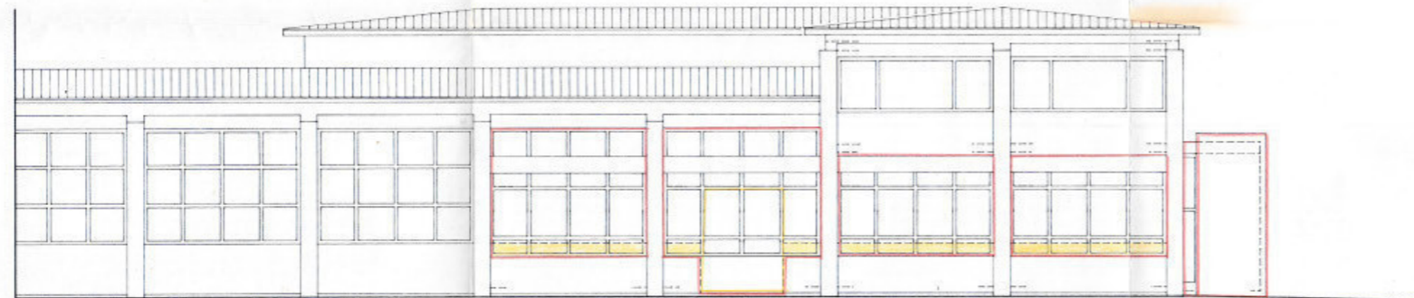
Südansicht M. 1:100

Genehmigt am 13. JUNI 2003 Stadt Göppingen Bürgermeisteramt